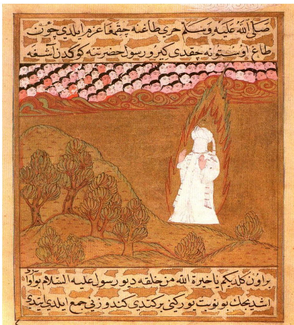
Mohammed ontvangt een Openbaring (Mohammed wordt doorgaans niet afgebeeld)

Na de ontvangst en de registratie begonnen we de avond met een voorspel. In de hal hebben de gasten een groepje gevormd en elke groep heeft een envelop met losse letters gekregen. Zij moesten van deze losse letters een woord maken dat iets met de Islam te maken heeft. Zij hebben heel